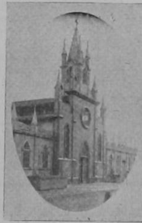
Fachada principal de las Escuelas Profesionales Salesianas