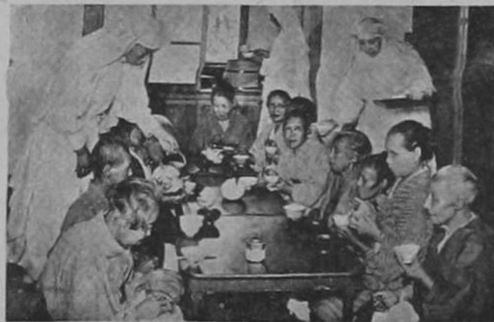
Las Misioneras Franciscanas de Maria sirven a los niños recogidos por la Santa Infancia